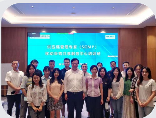
(移动采购共享服务中心SCMP培训班)

已为包括中国移动、国家电网、兵器集团、中国电信、中国通用、华能、南方电网、厦门建发、厦门国贸、厦门象屿、德国博世集团、广汽新能源汽车有限公司等在内的众多企业员工提供SCMP认证项目培训，且反响良好。