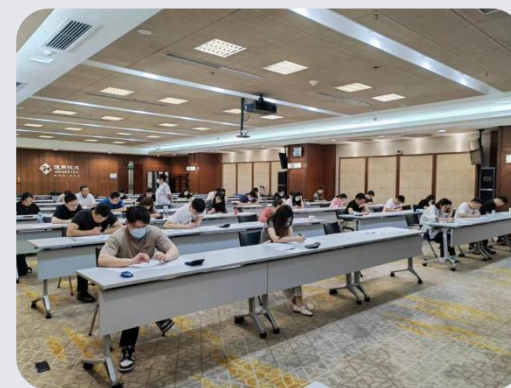
(通用集团SCMP内训班考试现场)